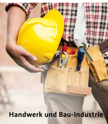
Handwerk und Bau-Industrie