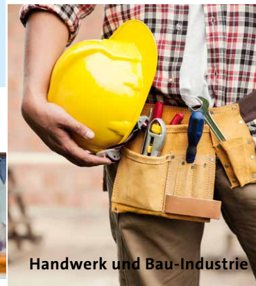
Handwerk und Bau-Industrie